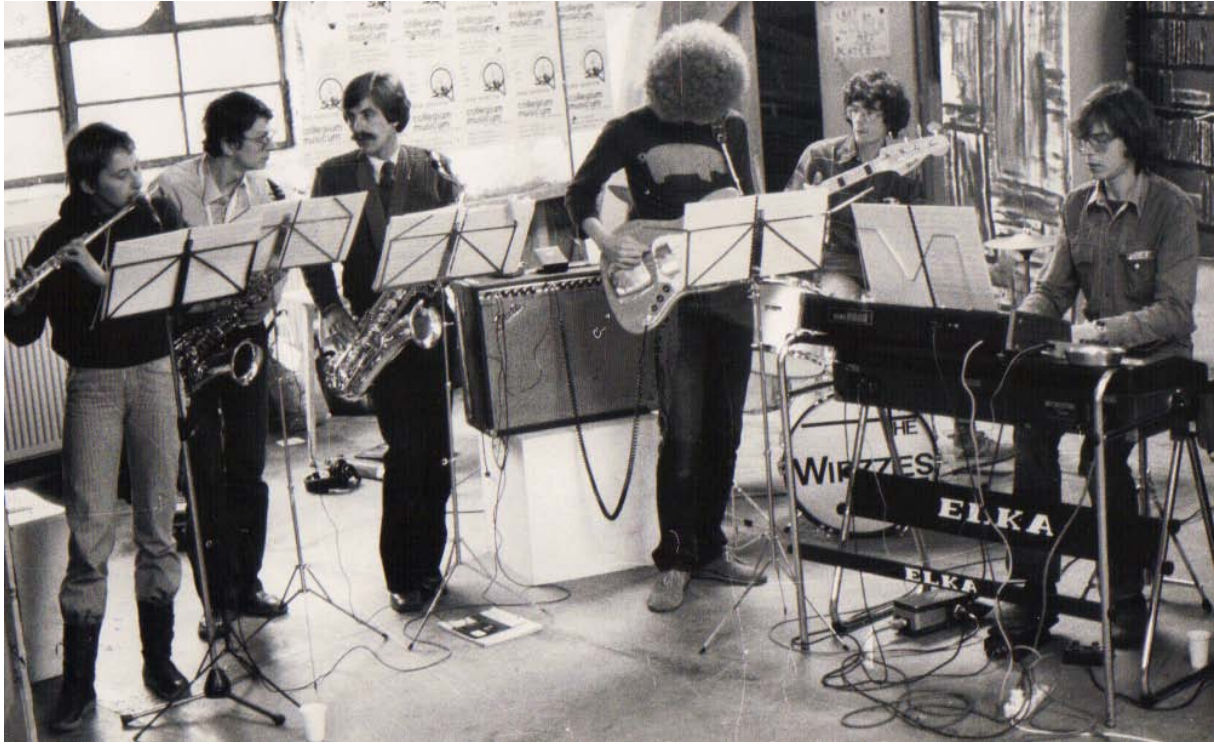
The Wirzzles in 1981