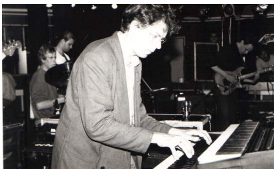
Met Crystal Feature in 1991